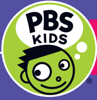
Tabla de lecturas de verano